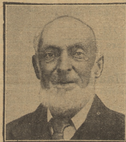
Den Heer TRIM (volgens een foto)

Er is altijd een oogmeester ten ieder beschikking.